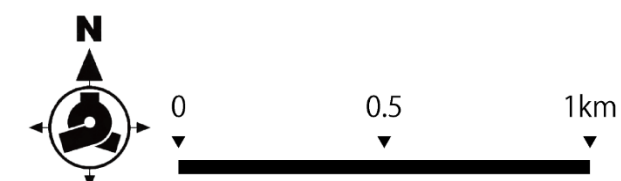
図5 重点整備地区図

※ 生活関連経路の種別 1次経路：歩行者ネットワークの根幹となる経路 2次経路：1次経路から派生するネットワークとなる経路 3次経路：1次、2次経路から生活関連施設までの経路